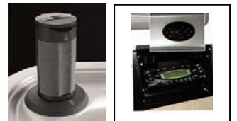
Stéréo CD MP3 Haut parleurs