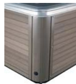
Jupe permawood Taupe