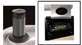
Stéréo CD MP3