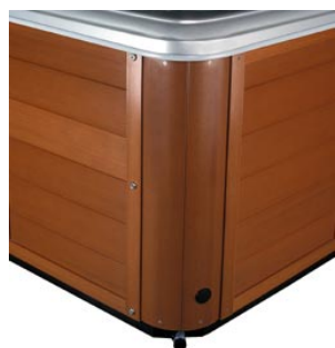
Jupe permawood Imitation bois